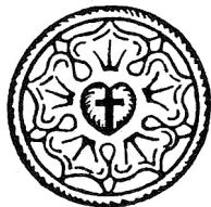
Luteri roos Luther Rose